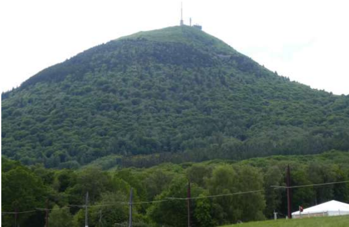
Blick über die Chaîne des Puys, eine Reihe erloschener Vulkane (Weltnaturerbe)